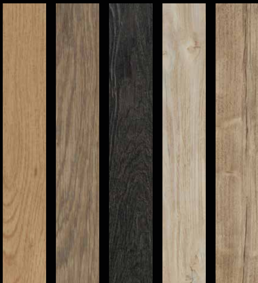
cc60065 honey elegant oak cc60374 natural collage oak cc60074 black rustic oak cc60084 bleached rustic pine cc60082 natural rustic pine

Storlek: 150,5x23,7 cm. Samtliga plank har fasad kant 4-sidor