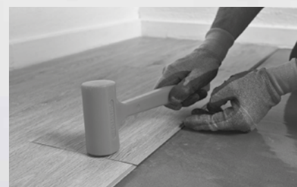
4. Lås kortändarna genom att lätt knacka ned dem med en gummiklubba