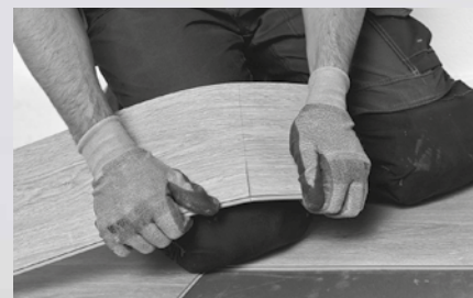
6. Och dela den sedan genom att knäcka den vid snittet