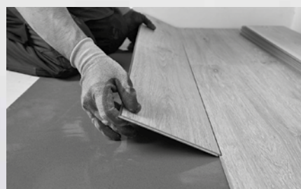
3. Vik ned rad för rad med ca 30° vinkel på längden