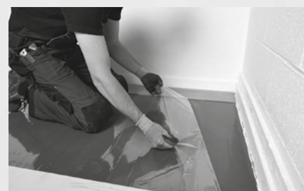
2. Avlägsna skyddsfilm från yta