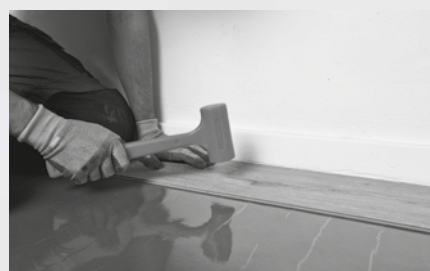
1. Montera första raden*

Se också de detaljerade lägningsinstruktioner som ingår i varje kartong.