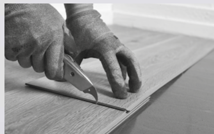
5. Skär plankor till rätt storlek genom att skära ett snitt med mattkniv