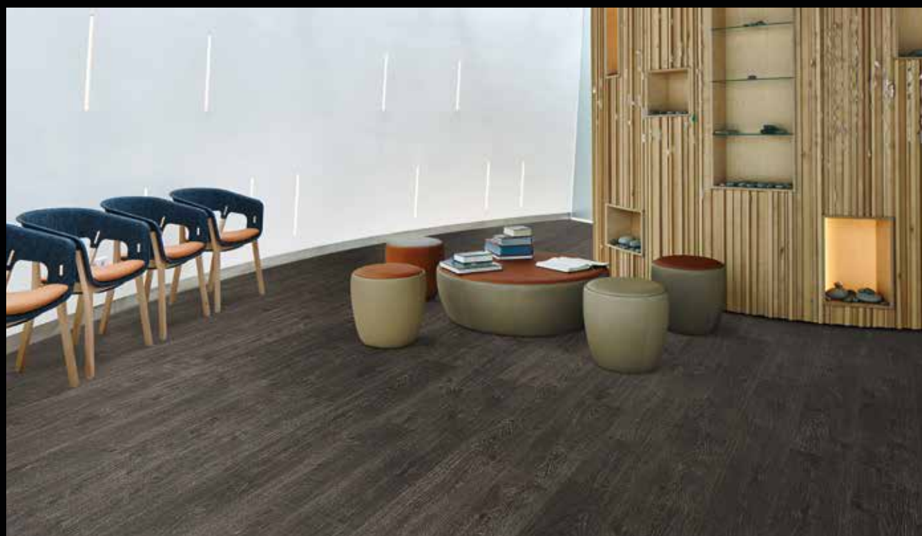
cc60074 black rustic oak

Storlek: 121,2x18,7 cm. Samtliga plank har fasad kant 4-sidor