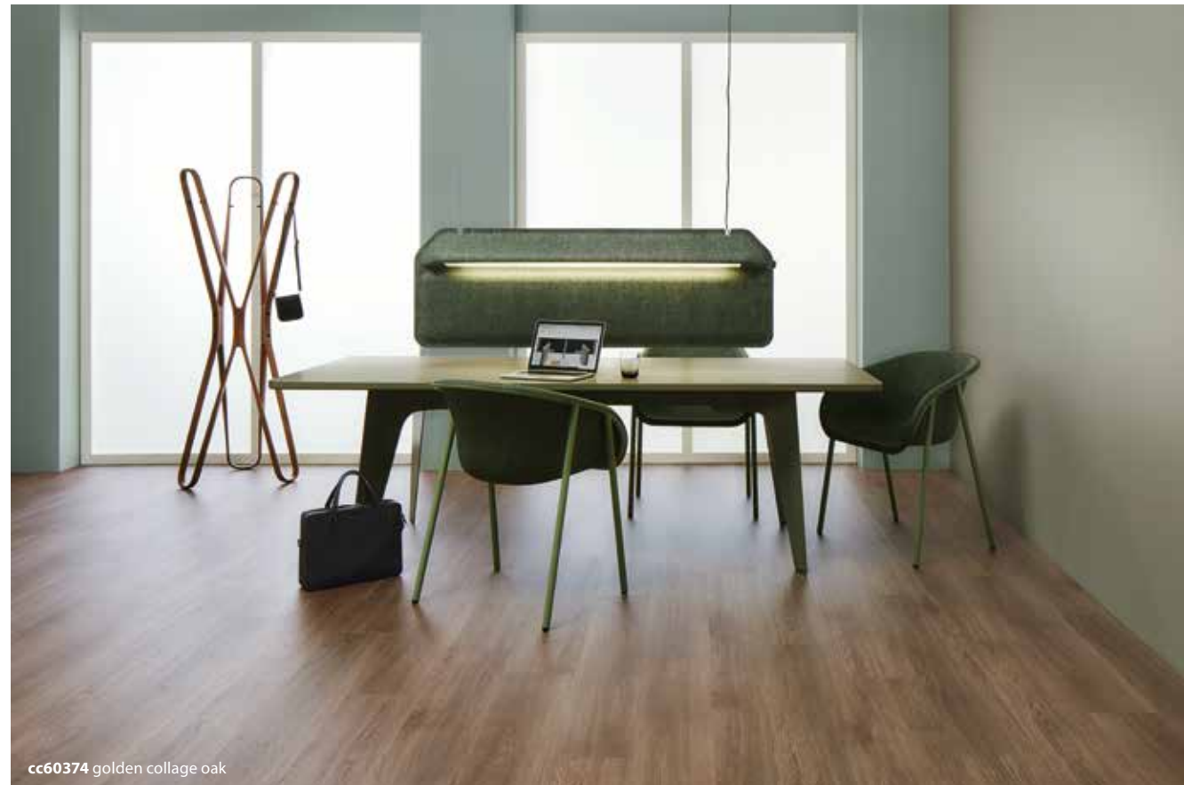
cc60374 golden collage oak

Använd i första hand torra rengöringsmetoder, som dammsugning och moppning, när du städar Allura Click. Om golvet är riktigt smutsigt så använder du ett mildt och neutralt rengöringsmedel.