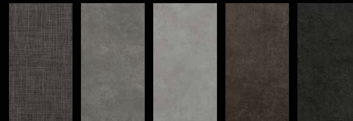
cc63604 graphite weeve cc62522 natural concrete cc62523 grigio concrete cc62419 nero concrete cc62404 black slate