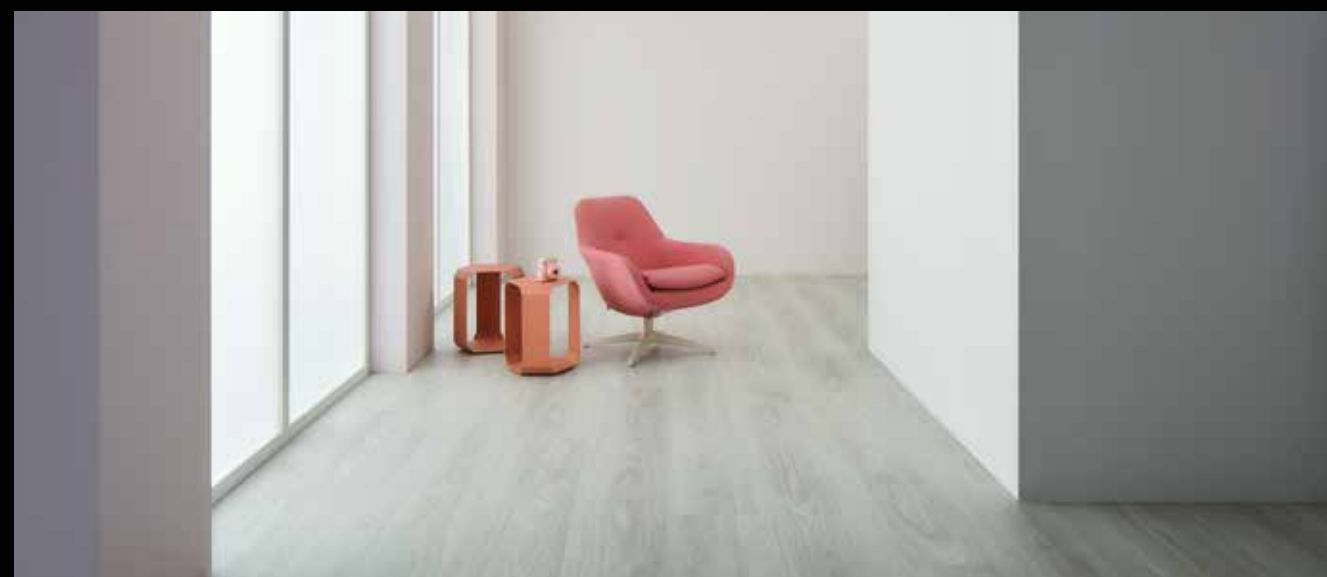
cc60286 white giant oak