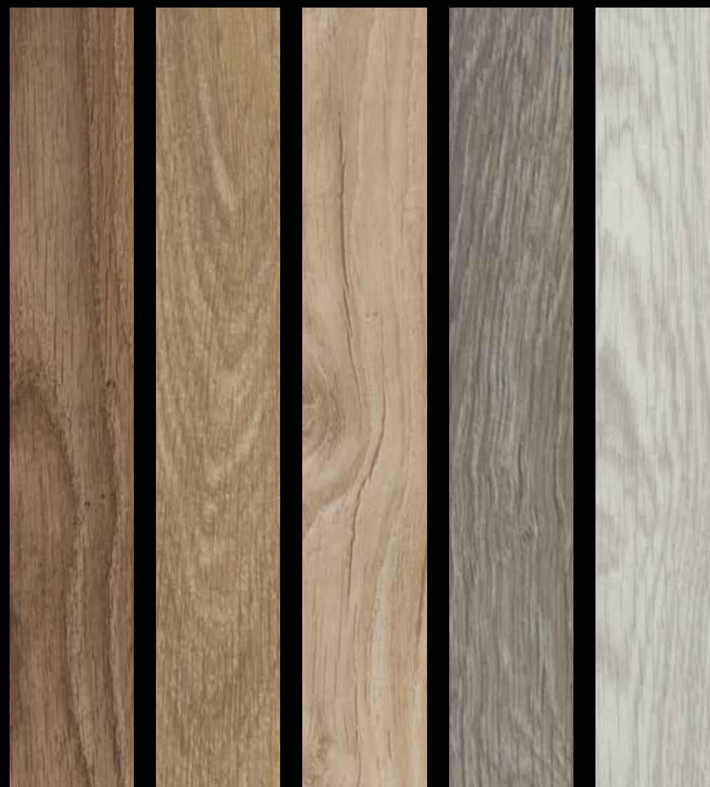
cc60302 deep country oak cc60284 natural giant oak cc60305 light honey oak cc60280 grey giant oak cc60286 white giant oak

Storlek: 150,5x23,7 cm. Samtliga plank har fasad kant 4-sidor