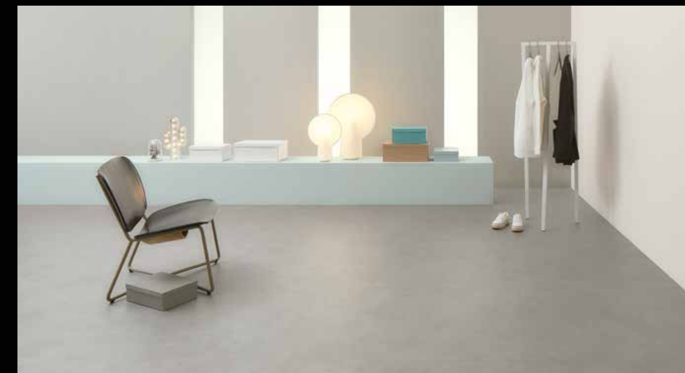
cc62523 grigio concrete